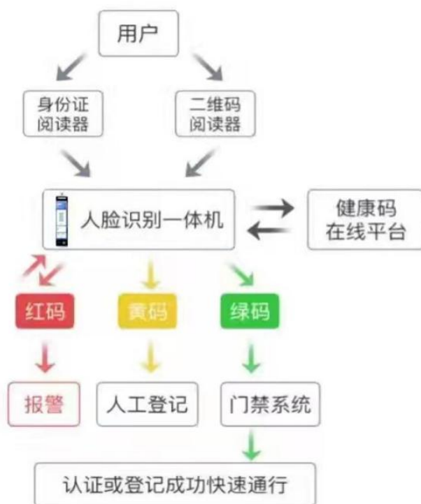
健康码快速认证登记流程图